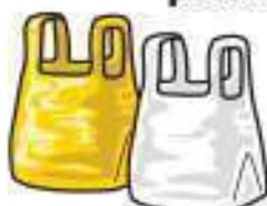
Plastizkoko poltsak eta zorroak