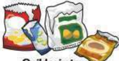
Opildegi eta litxarrerria poltsak