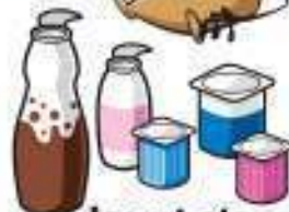
Jogurt eta antzekoak