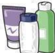
Xanpu, gel eta holakoak