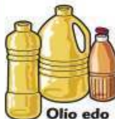
Olio edo ozpinarenak