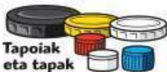
Tapoiak eta tapak