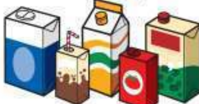
Esne, zuku, ardoarenak edo tomatearenak