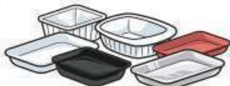
Plastikozko, poliespanezko eta aluminiozko bandejatxoak