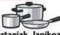
Zartagiak, lapikoak eta sukaldekoak