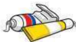
Hortzetako eta antzekoak