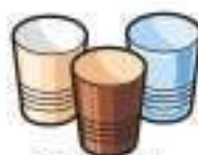
Kafe edo ur-makinetako edalontziak